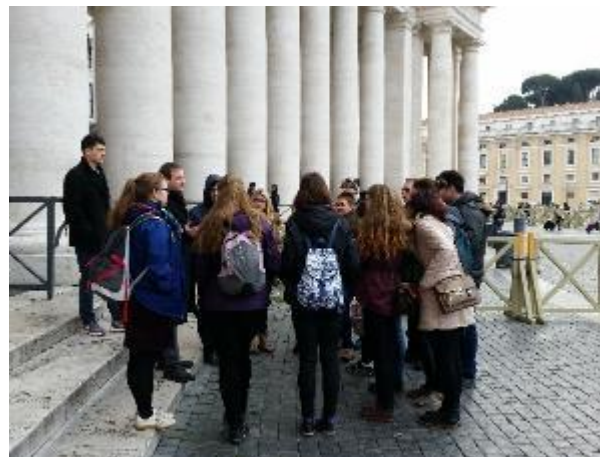
Városnézés közben, előtte a kirablás előtti csoportkép