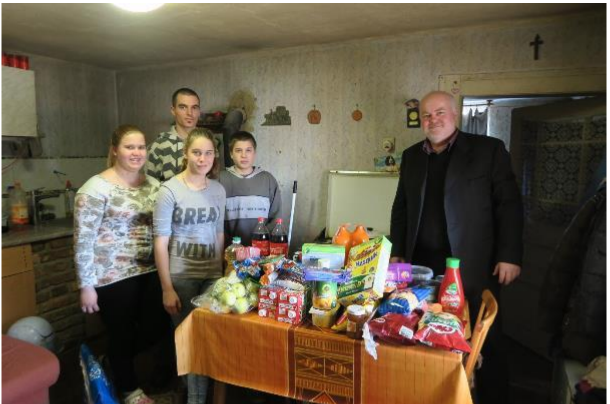
Első találkozásunkkor élelmiszert vittünk (kb 100CHF értékben)